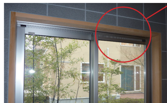
既存の窓に付いている換気プレス（上框一体タイプ） ※ 換気プレスは別体タイプの場合もあります。